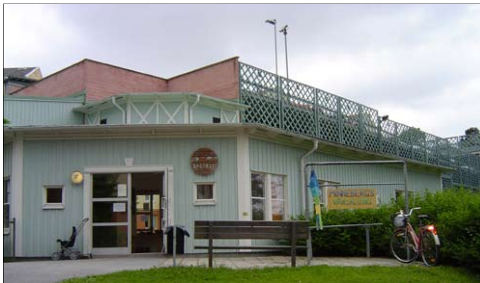
Badviken ligger på Svartviksslingan 17

I Minneberg finns det 2 samlingslokaler för större och mindre sällskap, Badviken och Båtviken. Dessa får hyras av föreningar och boende i Minneberg. Lokalerna är ganska stora och försedda med serveringskök. Porslin för middagsdukning ingår i hyran. Bokning av lokalerna sker genom Minnebergsseniörerna som har sin expedition på Svartviksslingan 59.