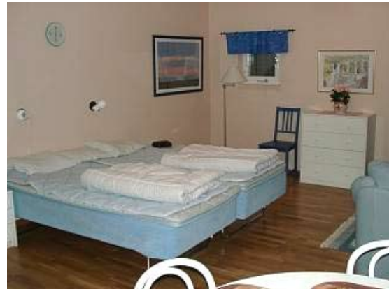
Brf Svartviks gästlägenhet på Svartviksslingan 17