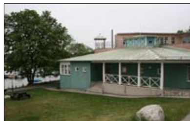
- Båtviken, Svartviksslingan 81

på annat sätt handskas med eld eller verktyg som kan åstadkomma gnistbildning eller värme. Kasta inte cigarettfimpar utomhus – de skräpar ner och kan vara farliga för barnen.