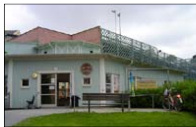
- Badviken, Svartviksslingan 17

För allas trivsel, rök inte i våra gemensamma utrymmen. På vinden är det absolut förbjudet att röka eller