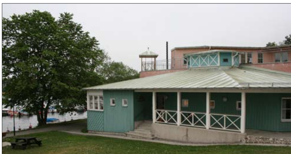
Båtviken ligger på Svartviksslingan 81

Expeditionstider hos Minnebergsseniörerna: