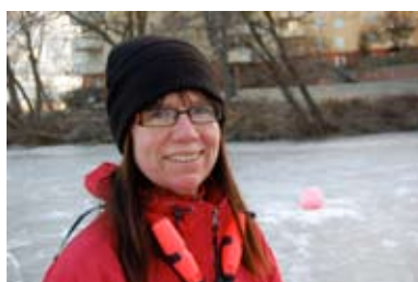
Redaktören på hal is.

Äntligen lade sig isen över Ulvsundasjön – vår Mälarvik som vissa vill byta namn på eftersom det ju inte är någon sjö!