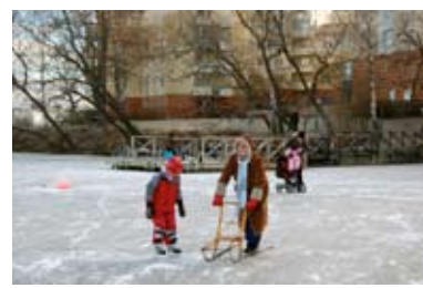
"Du har väl broddar, mormor?"