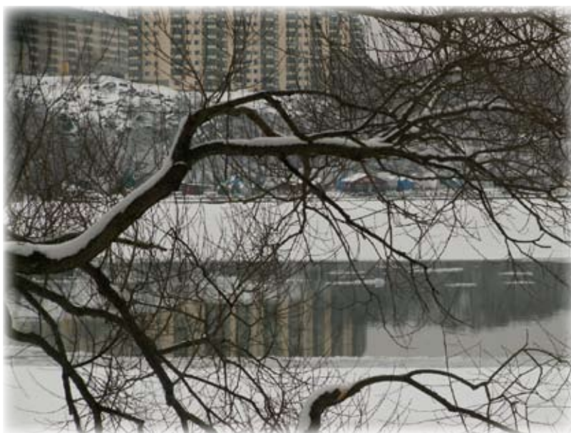
Våren närmar sig, isrännan blir allt bredare och i vattnet bakom trädet speglar sig husen på Solnasidan.