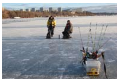
Pimplarna är alltid först ut.