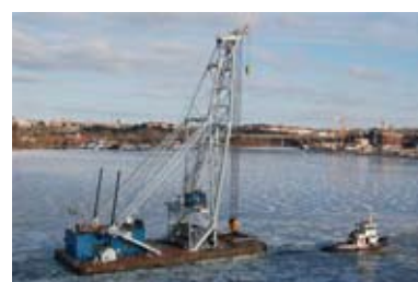
Störst men inte starkast.