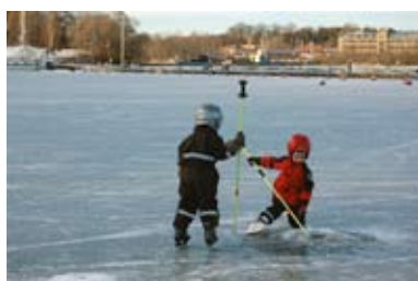
"Jag tror jag fått napp!"