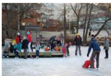
Badbryggan bäst också på vintern.