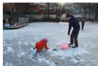
"Vilken stor bandyboll, pappa!"