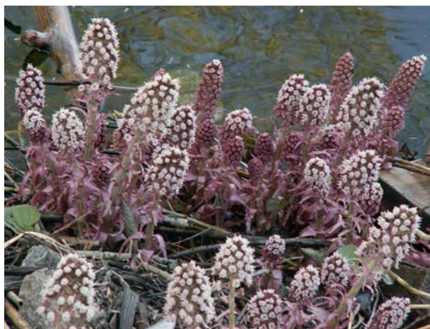
Pestskråp (Petasites hybridus)

Växer i Minneberg alldeles vid vattenytan nedanför 35:an. Hanplantorna har blekt röda blommor och trubbiga gröna holkfjäll. De vissnar snart efter blomningen. Honplantan är mycket sällsynt i Norden. Pestskråp infördes troligen under 1600-talet.