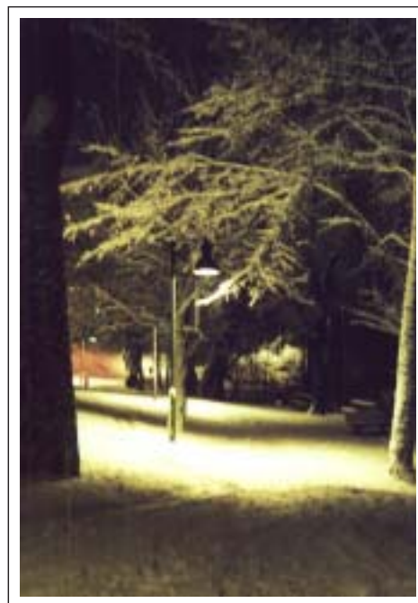
Belysningen längs strandpromenaden blev ett riktigt lyft i höst och vinterrusket!