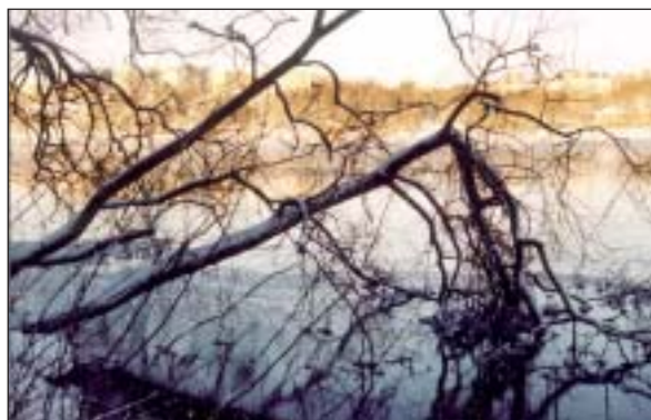
Knäckpil, utan julgran.

Visserligen har jag tränat grenen stövelkastning på Minnebergfestivalen – men granen var inte lika lättkastad. Först gällde det att kolla så att granen inte flög i skallen på någon joggare eller hundägare på strandpromenaden.