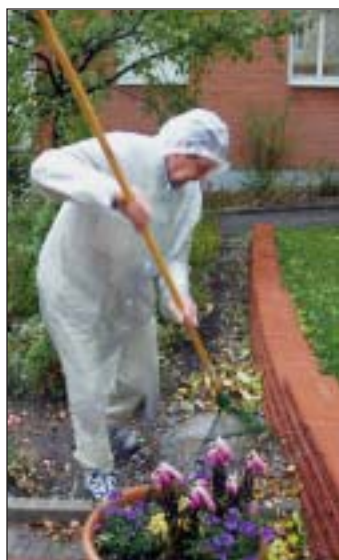
60 personer gav sig ut i hållande regn.