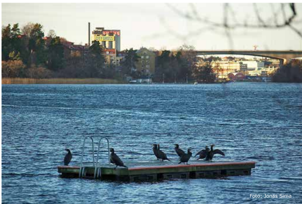
Skarvar ockuperar badflotten i Badviken.

Vidare gäller bland annat att referenser för den tänkta hyresgästen måste lämnas så att föreningen kan kontrollera hyresgästens lämplighet. Styrelsen arbetar på att ta fram ett skriftligt policydokument för uthyrning i andra hand. Dokumentet kommer publiceras på hemsidan när det är antaget och klart.