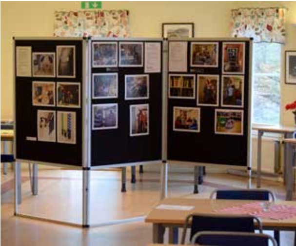
Utställning om Minnebergs föreningar.