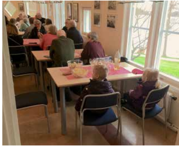
Unga och gamla kom för att lyssna på CK Duo.