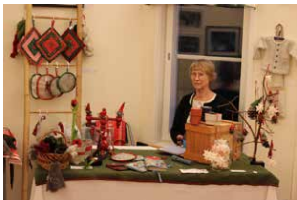
Det såldes även julpynt av olika slag.

En tradition i Minneberg är vävstugornas julmarknad vid första advent. I år hölls den i Badviken och var som vanligt uppskattad av de boende i området. Många fina hantverk visades upp och man kunde vinna fina priser på lotterierna.