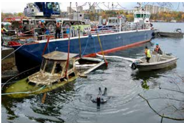
Dykare hjälpte till att puma läns.