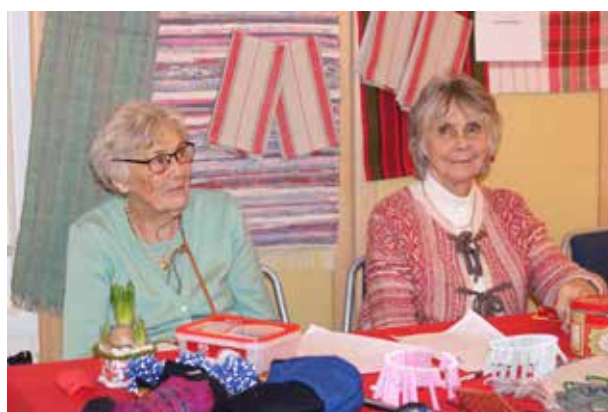
... och vävda mattor, dukar och handdukar.