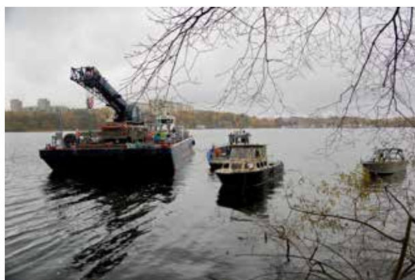
Vraket bogseras bort efter några timmars arbete.