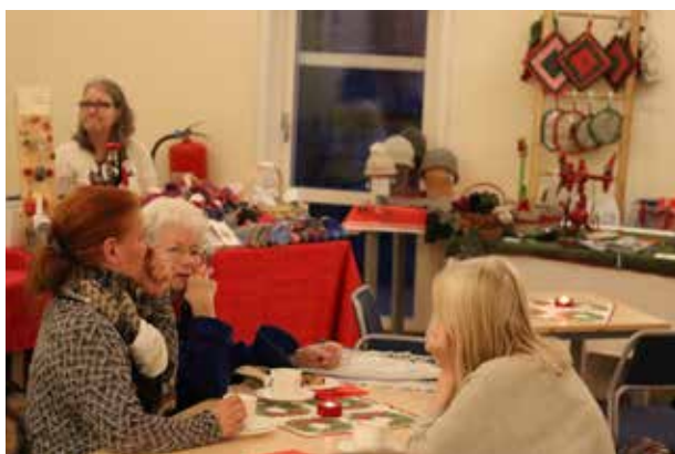
Det var många minnebergsbor som passade på att julfika.