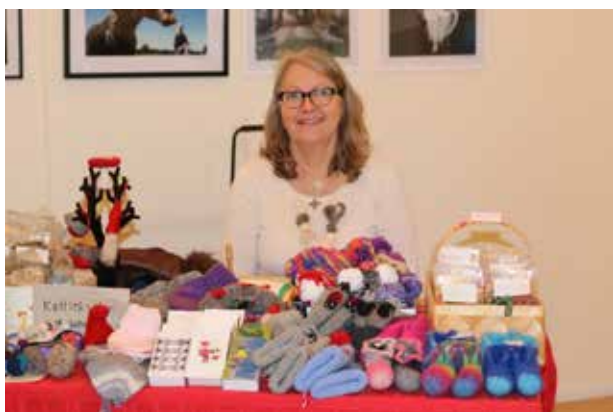
På julmarknaden kunde man köpa tovade föremål...