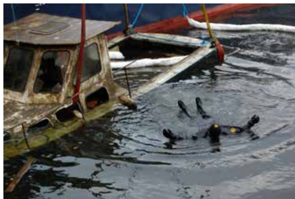
Paus i arbetet.