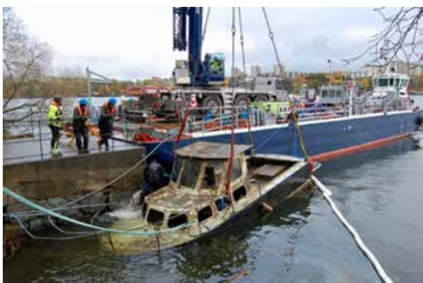
Vraket är på väg upp över ytan.